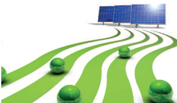
Solarenergie wird in zahlreichen Ländern wirtschaftlich wettbewerbsfähig.

Das derzeitige Angebot an Windprojekten in Deutschland und Frankreich ist allerdings mangels baureifer Projekte begrenzt. Des Weiteren kommen viele Projekte gar nicht auf den Markt, da einerseits Entwickler für die besagten Märkte strategische Allianzen mit Stadtwerken und Energieversorgern gebildet haben und andererseits größere Entwickler eigene Energieerzeugungskapazitäten aufbauen, um selbst Strom zu produzieren. Dieser Strategiewechsel zum sogenannten IPP (Independent Power Producer) kann für Developer hochinteressant sein, bedingt jedoch mehr Kapital. Die vorhin genannten strategischen Allianzen dienen vornehmlich dazu, die akuten Vorfinanzierungsproblematiken der Developer zu bewältigen. Dies führt dazu, dass Investoren generell im Wettbewerb um interessante Projekte frühzeitig mit Liquidität und erforderlicher Sachkompetenz einsteigen müssen.